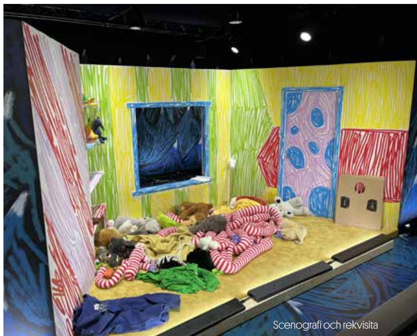
Scenografi och rekvisita

Att ge eleverna en möjlighet att gemensamt samtala om en föreställning är viktigt då det låter eleverna gemensamt processa sina intryck. Det kan stärka och fördjupa den konstnärliga upplevelsen, samtidigt som det hjälper dig som lärare att upptäcka vad eleverna fastnat för och därigenom hitta lämpliga pedagogiska infallsvinklar. Var noga med att inte forma samtalet så att eleverna upplever att de ska redovisa vad de kommer ihåg och förstått då det kan skapa motvilja både för samtalet och föreställningen. Försök i stället skapa ett samtal på elevernas villkor, där de kan dela med sig utifrån vad de själva har lust och behov av. Detta går att göra på en mängd olika sätt. På nästa uppslag följer en kort beskrivning av En väv av tecken som är den metod för konstnärliga samtal som vi på Riksteatern Barn & unga använder oss av.